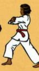
31 Owen palkoup Mom Tong pyo Yok Tchigui Oren Ap Goubi Sogui