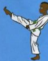
19 Ap Tchogui