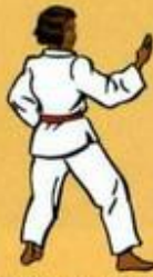
17 Hann Sonnal Mom Tong Bakat Maki Owen Dult Goubi Sogui