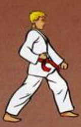
Are Maki Owen Ap Goubi Sogul