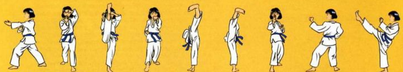
07 Oren Pyon Sann Keuf Seo Tchreuga Owen Ap Goubi Sogui 08 Je Pi Pom Mek Tchiga Owen Ap Goubi Sogui 09 Ap Tchagu 10 Mom Tong Baro Jileuga Oren Ap Goubi Sogui 11 Yop Tchagu 12 Yop Tchagu 13 Sonnal Mom Tong Maki Oren Duit Goubi Sogui 14 Mom Tong Bakat Maki Owen Duit Goubi Sogui 15 Ap Tchagu