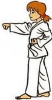
Mom Tong Baro Jileugui