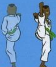
(De dos) 33 Ap Tchogui (vu de face)