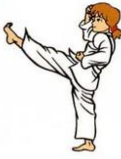
Mom Tong Ap Tchagui