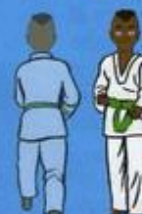
26 Ané Maki (vu de face) OWIN AP SOGŬI