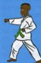
20 Mom Tong Tou Bon Jileugui OWIN AP GOUM SOGŬI