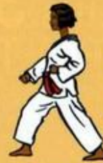
04 Are Maki Oren Ap Goubi Sogui