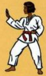
15 Hann Sonnal Mom Tong Bakat Maki Owen dult Goubi Sogui