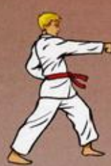
Mom Tong Baro Jileugui Owen Ap Goubi Sogul