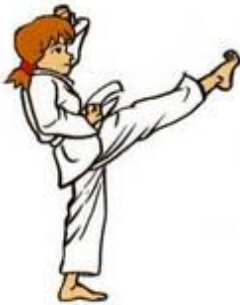
Mom Tong Ap Tchagui