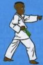
5 Mom Tong Tou Bon Jileugui OWIN AP GOUM SOGŬI