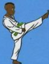
23 Ap Tchogui