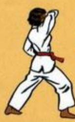
32 Eul Goul Maki Oren Ap Goubi Sogui