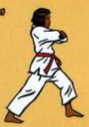
34 Oren Palkoup Mom Tong Pyo Yok Tchigui Owen Ap Goubi Sogui