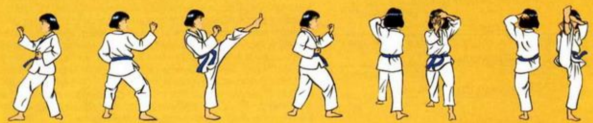
16 Mom Tong Ann Maki Owen Duit Goubi Sogui 17 Mom Tong Bakat Maki Oren Duit Goubi Sogui 18 Ap Tchagu 19 Mom Tong Ann Maki Oren Duit Goubi Sogui 20 Je Pi Pom Mek Tchiga Owen Ap Goubi Sogui 21 (de face) 22 Ap Tchagu 23 (de face)