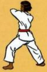
16 Palkoup Mom Tong Dollo Tchigui Oren Ap Goubi Sogui