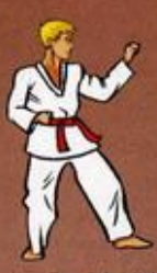
Mom Tong Bakat Maki Owen Duit Goubi Sogul