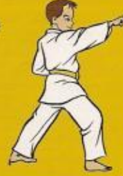
10.eul goul bandae jileugui pos. óren ap goubi sogui