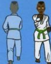
(De dos) 35 Mom Tong Baro Jileugui avec Khiep (vu de face) OWIN AP SOGŬI