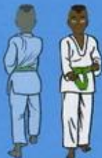
(De dos) 28 Ané Maki (vu de face) OWIN AP SOGŬI