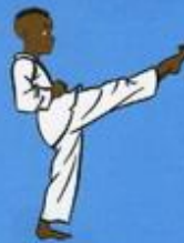
3 Ap Tchogui