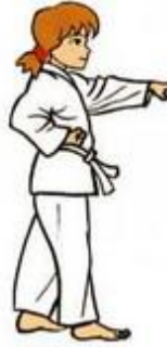
Mom tong Baro Jileugui