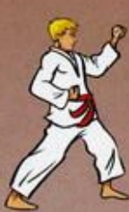
Eul Goul Bakat Maki Owen Ap Goubi Sogul