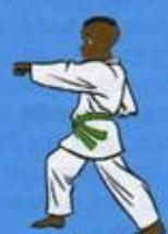
21 Mom Tong Tou Bon Jileugui OWIN AP GOUM SOGŬI