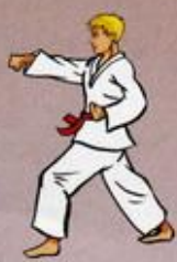
Mom Tong Baro Jileugui Owen Ap Goubi Sogul