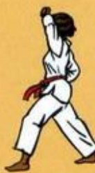
29 Eul Goul Maki Owen Ap Goubi Sogui