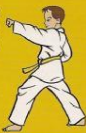
13.eul goul bandé jileugui pos. ówen ap goubi sogui