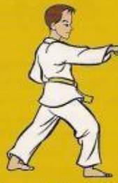
3.mom tong ban dae jileugui pos. óren ap goubi sogui