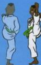
(De dos) 30 Ap Tchogui (vu de face)