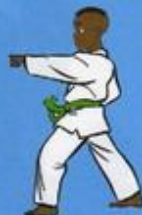
8 Mom Tong Tou Bon Jileugui OWIN AP GOUM SOGŬI