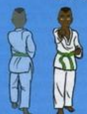
(De dos) 32 Mom Tong Baro Jileugui (vu de face) OWIN AP SOGŬI