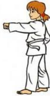
Mom Tong Ban Dae Jileugui