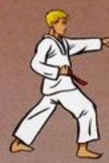
Mom Tong Baro Jileugui Oren Ap Goubi Sogul