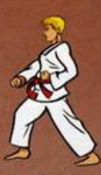
Are Mari Oren Goubi Sogul