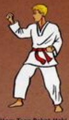
Mom Tong Bakat Maki Oren Duit Goubi Sogul