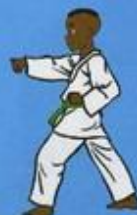
9 Mom Tong Tou Bon Jileugui OWIN AP GOUM SOGŬI