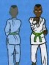
(De dos) 27 Mom Tong Baro Jileugui (vu de face) OWIN AP SOGŬI