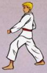
Are Maki Owen Ap Goubi Sogul