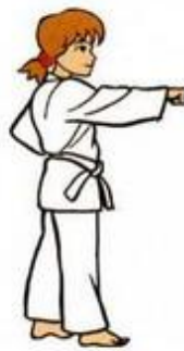
Mom Tong Ban Dae Jileugui