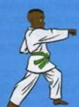
13 Mom Tong Baro Jileugui OWIN AP GOUM SOGŬI