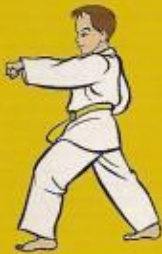
5.mom tong bandé jileugui pos. ówen ap goubi sogui