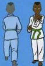
(De dos) 29 Mom Tong Baro Jileugui (vu de face) OWIN AP SOGŬI