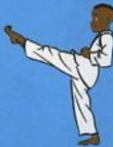
7 Ap Tchogui