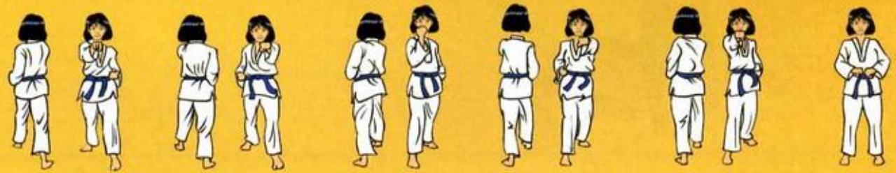
32 Mom Tong Baro Jileuga Owen Ap Goubi Sogui 33 (de face) 34 Mom Tong Bari Dae Jileuga 35 (de face) 36 Mom Tong Maki Oren Ap Goubi Sogui 37 (de face) 38 Mom Tong Baro Jileuga Oren Ap Goubi Sogui 39 (de face) 40 Mom Tong Bari Dae Jileuga Oren Ap Goubi Sogui 41 (de face) 42 Ki Bon Joun Bi Joun Bi Sogui