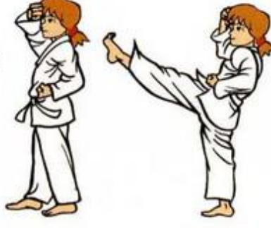
Eul goul Maki