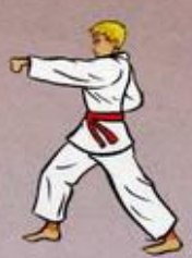
Mom Tong Baro Jileugui Oren Ap Goubi Sogul