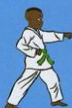
24 Mom Tong Tou Bon Jileugui OWIN AP GOUM SOGŬI