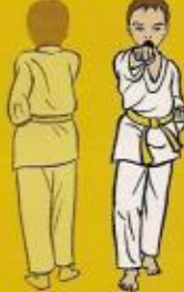
24.mom tong bandé jileugui pos. óren ap sogui (KIAP !)