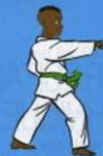
4 Mom Tong Tou Bon Jileugui OWIN AP GOUM SOGŬI