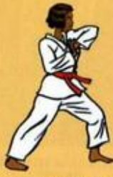
18 Palkoup Mom Tong Dollo Tchigui Owen Ap Goubi Sogui