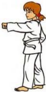
Mom Tong Ban Dae Jileugui