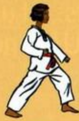
02 Are Maki Owen Ap Goubi Sogui