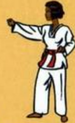
05 Mejourmok Nerio Tchigui Oren Sogui