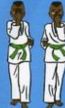
10/11 Hann Sonnal Je Pi Pŕm Mak Tchigui OWIN AP SOGŬI / OWIN AP SOGŬI