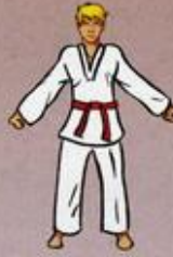
Are He tcho Maki Pieuni Sogul