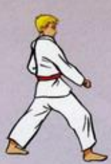
Are Maki Oren Ap Goubi Sogul