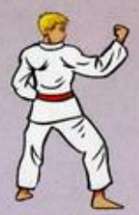
Mom Tong Bakat Maki Oren Duit Goubi Sogul