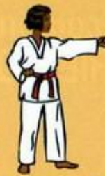
03 Mejourmok Nerio Tchigui Owen Sogui