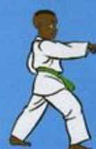
25 Mom Tong Tou Bon Jileugui OWIN AP GOUM SOGŬI