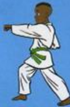
15 Mom Tong Baro Jileugui OWIN AP GOUM SOGŬI