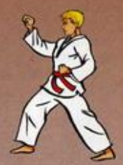
Eul Goul Bakat Maki Oren Ap Goubi Sogul